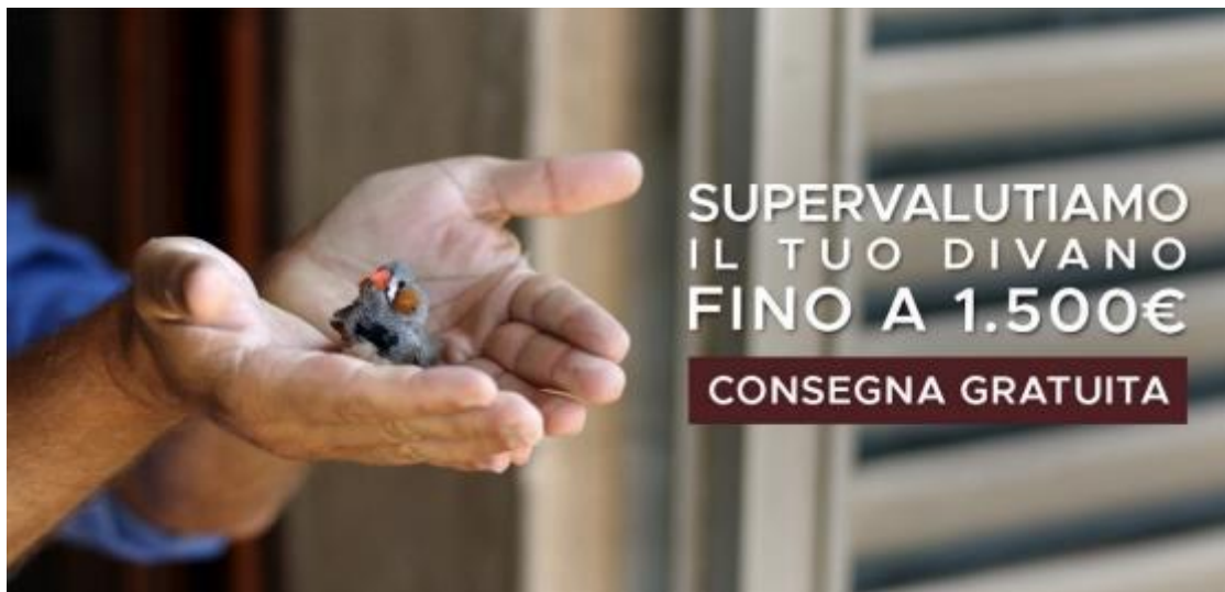
Fig. 4 promozione "Supervalutiamo il tuo divano fino a 1.500 Euro"

27. Gli elementi acquisiti nel corso del procedimento hanno confermato quanto lamentato dai segnalanti. Infatti, nelle comunicazioni del professionista indirizzate alla rete di vendita si precisava che la supervalutazione era da intendersi come uno sconto percentuale (con un beneficio massimo "fino a 1.500 Euro") già calcolato e indicato nel prezzo riportato sul cartellino 17 e garantito a tutti i clienti, a prescindere dalla valutazione di un eventuale usato 18 . La promozione non prevedeva il ritiro del divano usato, che poteva essere richiesta a pagamento dal consumatore interessato.