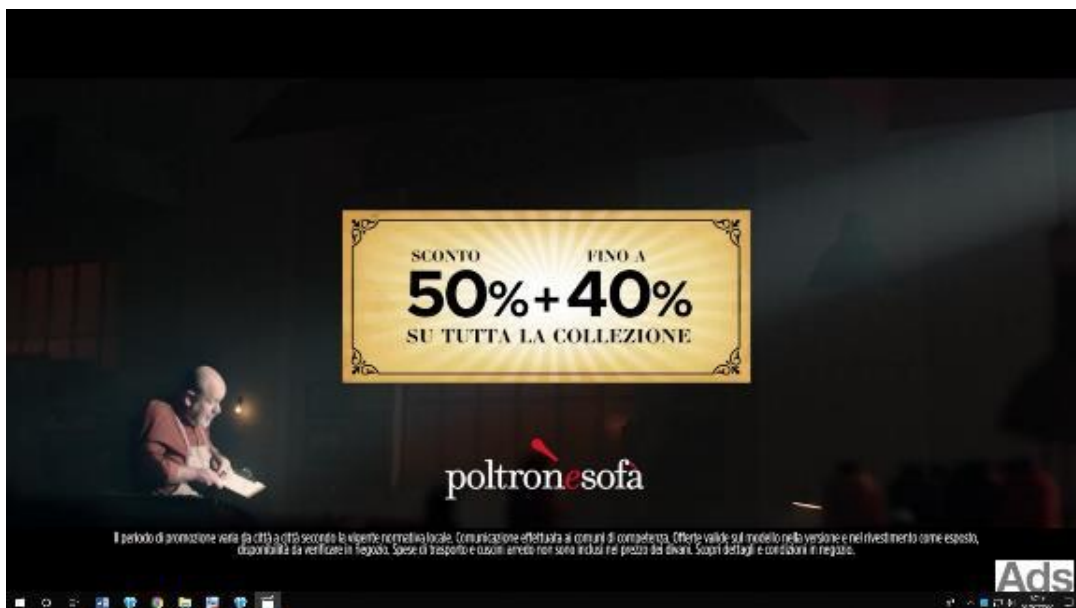
Fig. 1 promozione "doppi saldi doppi risparmi – sconto 50% + fino a 40% su tutta la collezione"

22. Inoltre, dalle evidenze raccolte risulta che, nell'ambito della promozione "doppi saldi doppi risparmi", la scadenza dell'offerta "48 mesi senza interessi", inizialmente prevista il 9 febbraio 2020 (come risulta dai messaggi trasmessi nel periodo 4 gennaio - 12 gennaio 2020 8 ), è stata anticipata al 19 gennaio: i messaggi diffusi dal 15 gennaio fino al 19 gennaio 2020 pubblicizzavano, mediante la dicitura su sfondo rosso " termina domenica 19 gennaio " 9 (cfr. fig. 2) che l'offerta del finanziamento "48 mesi senza interessi" sarebbe scaduta domenica 19 gennaio 2020.