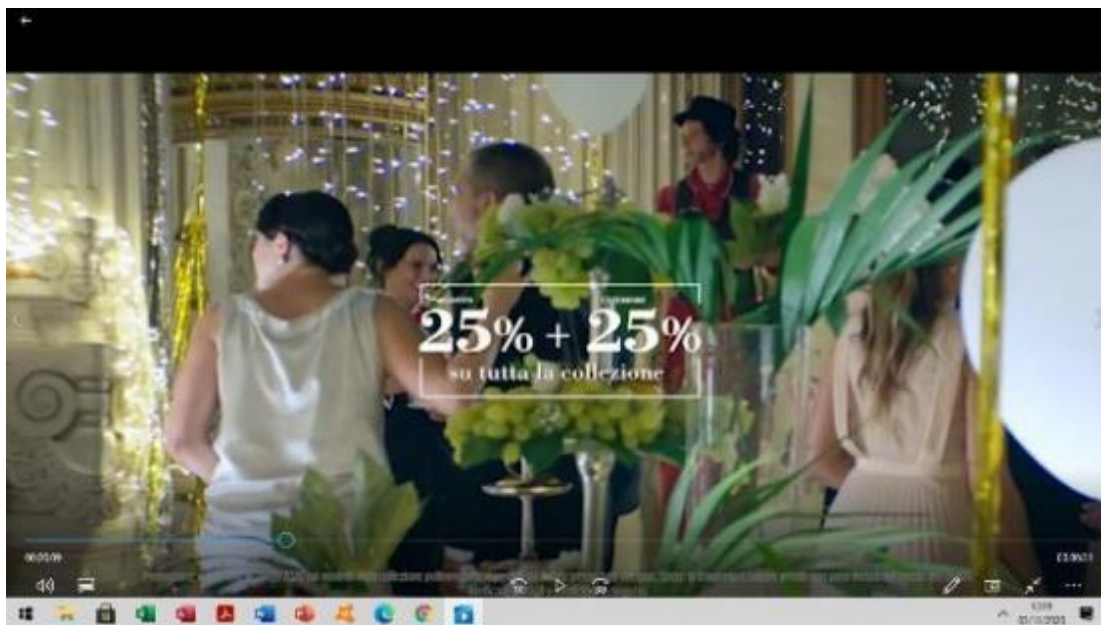
Fig. 5: promozione "25% di sconto + un altro 25% su tutta la collezione".

31. Infine, ciclicamente, durante il periodo di validità della promozione (circa un mese) sono state reiterate affermazioni quali "cosa aspettate c'è tempo solo fino a domenica", "cosa aspettate c'è tempo solo fino a domani" 22 , lasciando intendere ai consumatori che l'offerta fosse disponibile solo per un periodo limitato di tempo, con scadenza la domenica della settimana in corso.